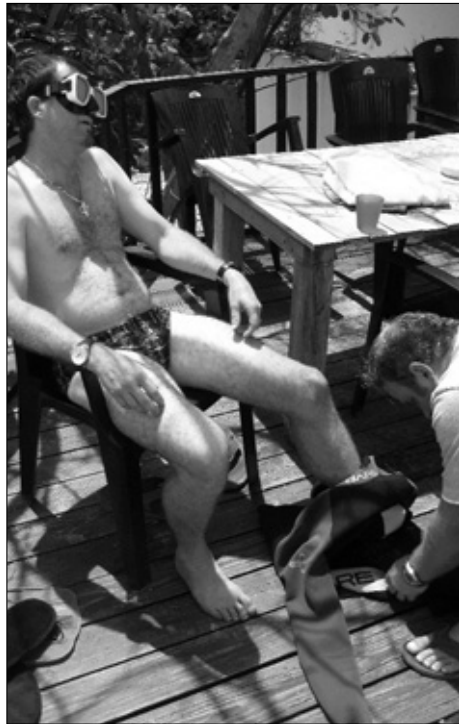
Bij de cursus leren de instructeurs ook iemand aankleden die verlamd is.