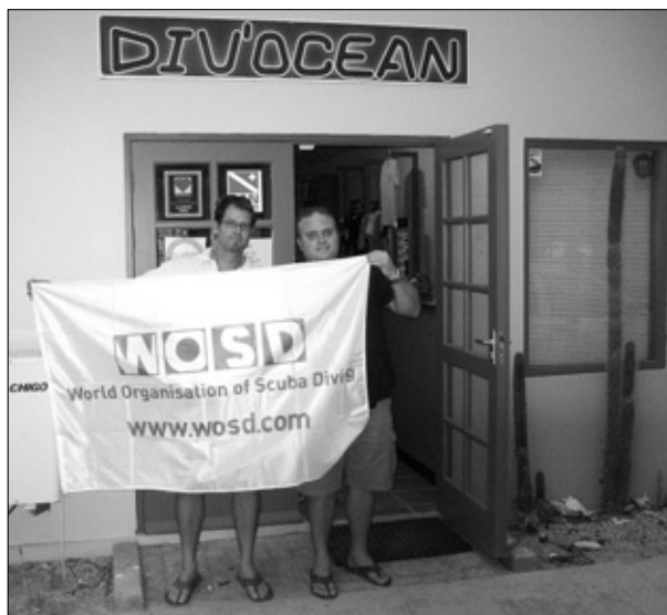
Curious2Dive is verbonden aan de World Organization of Scuba Diving.